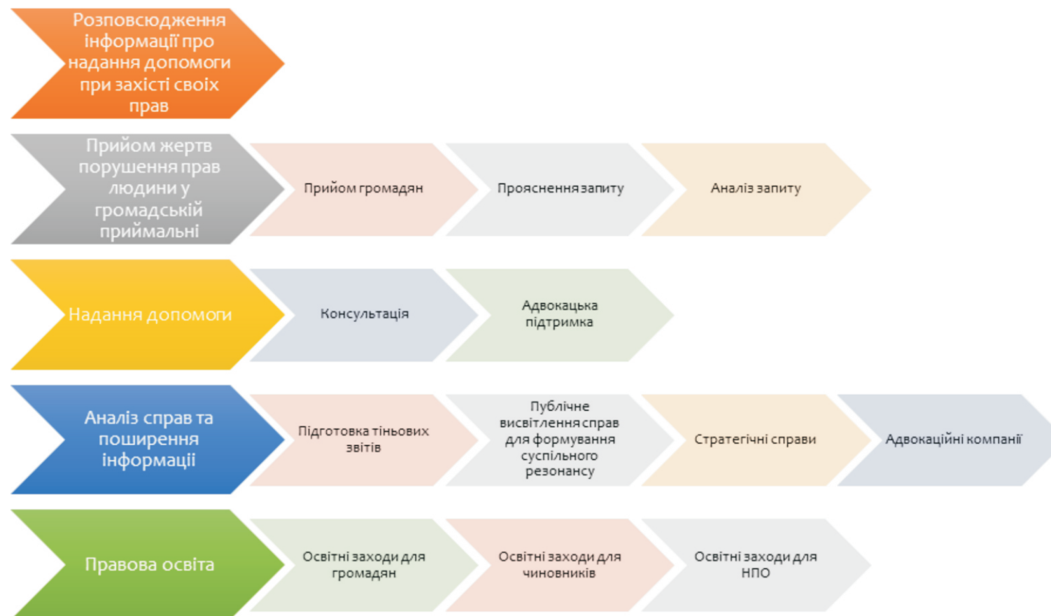
Діаграма 1. Логіка втручання